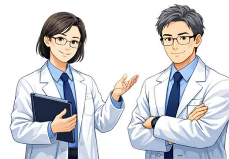
支援専門教員 (准教授・助教)